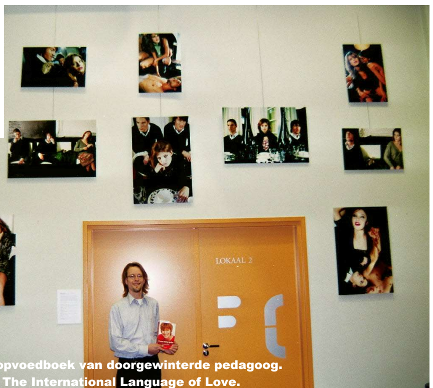
Uw scribent met opvoedboek van doorgewinterde pedagoog. Tussen foto's van The International Language of Love.