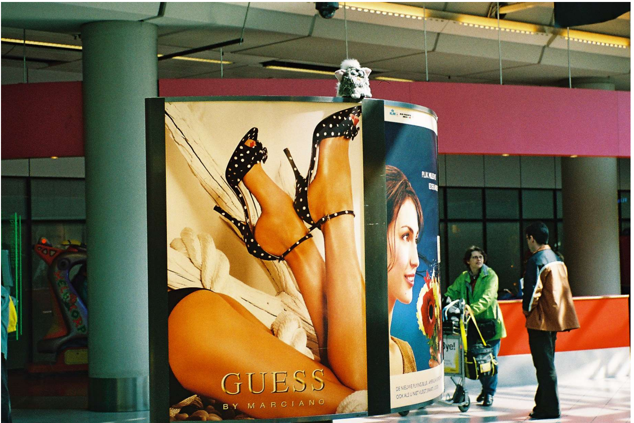
Zei ik het niet? Flowtail, boven de weg zweven, het hoeft niet hard te gaan om leuk te wezen?