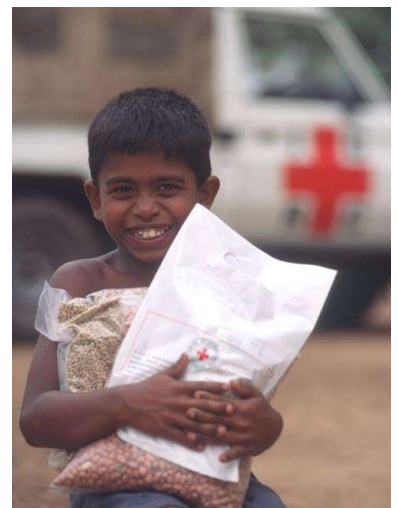
Jong geleerd ...

Onze uitgedijde ontwikkelingshulp wordt zo tweewegverkeer en aldus helpen Aardenhoutse Nederlanders met teveel geld en tijd noodlijdende Nederlanders die meerdere baantjes hebben. Maar ook lokaal ondernemen loont. Initiatiefrijke ondernemers zetten insulinefabriekjes op en growshops scholen om tot doe-het-zelf kinaboomplantages (griepremmer kinine).