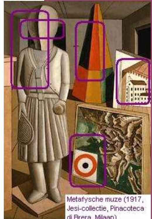
Metafysche muze (1917, Jesi-collectie, Pinacoteca di Brera, Milaan). Beïnvloed door Giorgio de Chirico, Alberto Savinio, de Mensheid is een Klucht en Filippo de Pisis.

We weten dat u vriendinnen heeft. We weten dat ze u allen even lief zijn, want vrouwen doen veel aan gelijkheid en zusterschap en dat siert ze. Nu even niet. Wat wel? Versterk uw uitstraling. Hoe? Uw gezelschap zoekt u nét een beetje suffer dan u. Zijn we waar de actie is, doet ze iets voor zichzelf. Dat is dus belangrijk, en toch best wel een beetje jammer (dus of Judith van de hoogbegaafdenschool en het gesprek over drank&rook_terwijl_festival_onder_Dijkzigt zich even wil melden).