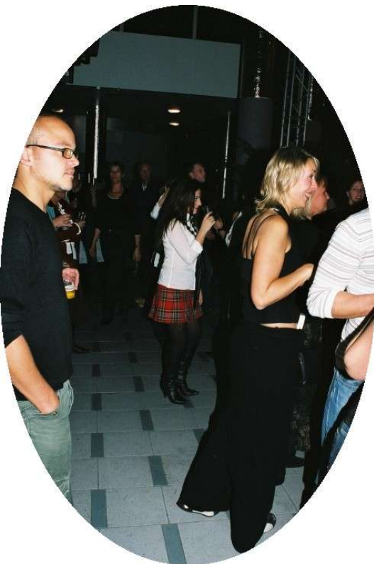
Uitbater van het café Dik-T en medewerkers